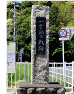
一言坂の戦跡 石碑 浜松城に退却する途中の徳川軍が武田軍と戦った場所