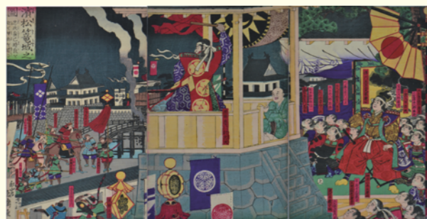
三方原浮世絵(佐口行正氏所蔵)

見付商店街の繁栄の証である美しい「引き札」(木版画)や、家康と関わる浮世絵を数々展示します。