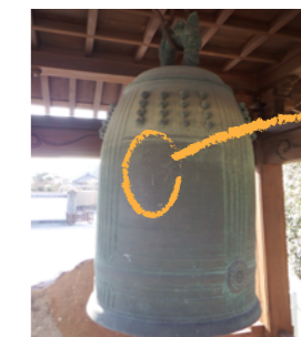
宣光寺の梵鐘 家康が宣光寺に寄進した梵鐘 家康のフルネームは徳川次郎源朝臣家康