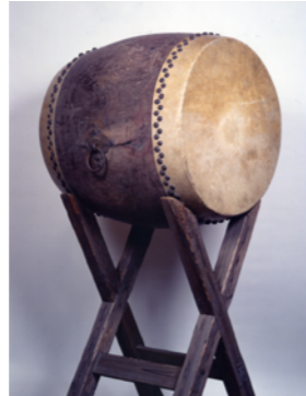
酒井の太鼓(旧見付学校) 三方ヶ原の戦いで家康の窮地を救ったと伝わる太鼓