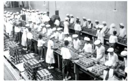
(台湾合同鳳梨(株)の缶詰工場)

終戦直前の頃には、パイナップル缶詰の世界三大供給源の一つとなり、特に軍隊の保存食として重宝されていました。戦後、此の会社は、台湾鳳梨会社に引き継がれております。