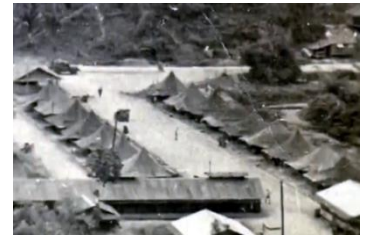
(ヒリピンの捕虜収容所)

「之を飲んで私のベッドで休んでいなさい」と言って自身のベッドも提供して下さいました。