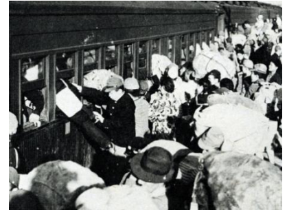
(終戦直後の満員列車)

私の服の背中にPWのマークが付いて居り、靴もアメリカ製だったから声をかけられたのだと思います。其の十九ドル二十セントと交換したのが、パイ缶六キンでした。此のパイ缶の味は特別でした。