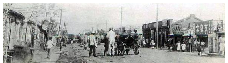
（ 旧満州 勃利 正直街 ）

ある日曜日に、同年兵と二人で勃利の町中を散策していた時、雑貨店の軒先に珍しい光景があるではありませんか。それは横に吊るしてある竿に拾