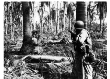
(ジャングルでの戦闘)

ハイエナを気にしつつ前進して居ると、遙か前方に林が見えるではありませんか。藁をも掴む思いで林の中に入る事が出来、 せんざんこう 『仙山甲』ではないが、お互い自分だけが入る穴掘りが始まりました。