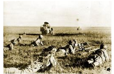
（ 匍匐前進 ）

毎日三度の食事、当番が順番に回つて来て、飯場の号令で一斉に採りに行き、古兵も新兵も同じテーブルでしたので、配飯が終ると、新兵はトロロ汁の様に御飯を流し込む様に済ませ、古兵の食事の済むのを待つて居て、箸を置くのを見て、奪う様に持ち去り洗つてあげる事は、当時の新兵の古兵へのマナアの様な時代でした。