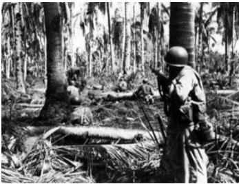
ジャングルでの戦闘