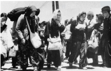
満州から引き上げる開拓民

噂によれば我々は、規格船に乗りバシイ海峡を越えヒリピン迄行くのだとか。我ら兵卒の知る由もなく、放牧された羊の様に、南十字星を眺め乍ら、センチメンタルに耽る自分でした。白い光の尾を残して消え行く流星も、 やが 聴ては我が身と心に念ずるのです。