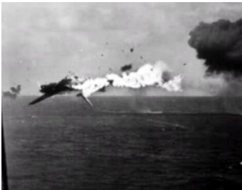
洋上で撃墜される戦闘機

之から此の船団はバシイ海峡を越えてヒリピン・ルソン島のマニラ港に行くのだとか。此の船団を援護して呉れるであろう護衛艦一