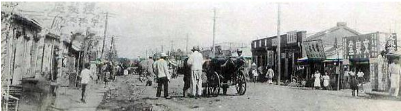
旧満州 勃利 正直街

ある日曜日に、同年兵と二人で勃利の町中を散策していた時、雑貨店の軒先に珍しい光景があるではありませんか。それは横に吊るしてある竿に拾匹位の野鳥が首を曲げて吊るしてあるのです。見れば銃で撃たれた傷もあります。店の主人に尋ねたら、「大豆を焼酎に一日漬